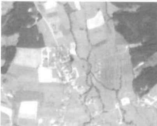
Abb. 2: Ausschnitt aus dem panchromatischen Kanal von IRS-1C: Wäsen in Oberösterreich

Das erste System welches nun tatsächlich in Betrieb gehen dürfte wird im Sommer 1997 der „Quick Bird“ der Firma „EarthWatch“ sein [W3]. Er soll mit einer Start-1 Rakete (eine umgebaute SS-25 Interkontinentalrakete) vom neuen russischen Kosmodrom Svobodny aus in die Umlaufbahn gebracht werden. Der Satellit wird im panchromatischen Bereich 3m und multispektral 15m Pixel-Auflösung haben (Tab. 3). Dieselbe Firma hat für einen Start im Jahr 1998 einen weiteren Satelliten „Quick Bird“ angekündigt,