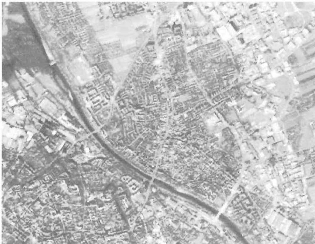
Abb. 1: Augsburg, aufgenommen von MOMS-02 auf der Station MIR

Bereits seit längerem sind von amerikanischer Seite kommerzielle hochauflösende Systeme angekündigt, wobei sich Firmenkonsortien mit