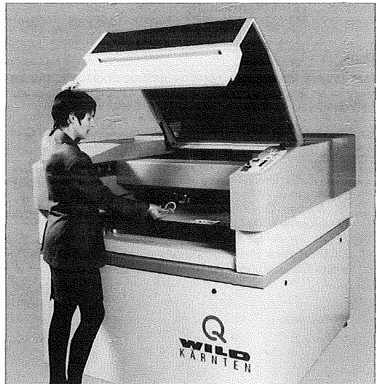
Abb. 1: WILD Laserplotter WK-LP 1007

Im Gegensatz zu sonstigen Laserschneidegeräten ist der WILD-Laserplotter ein sehr kompaktes und transportables Gerät (Abb. 1). Die Ansteuerung erfolgt mit der Plottersprache HPGL mit einigen speziellen Erweiterungen. Es gibt dazu geeignete CAM-Software, welche gängige CAD-Formate wie z.B. AutoCAD DXF