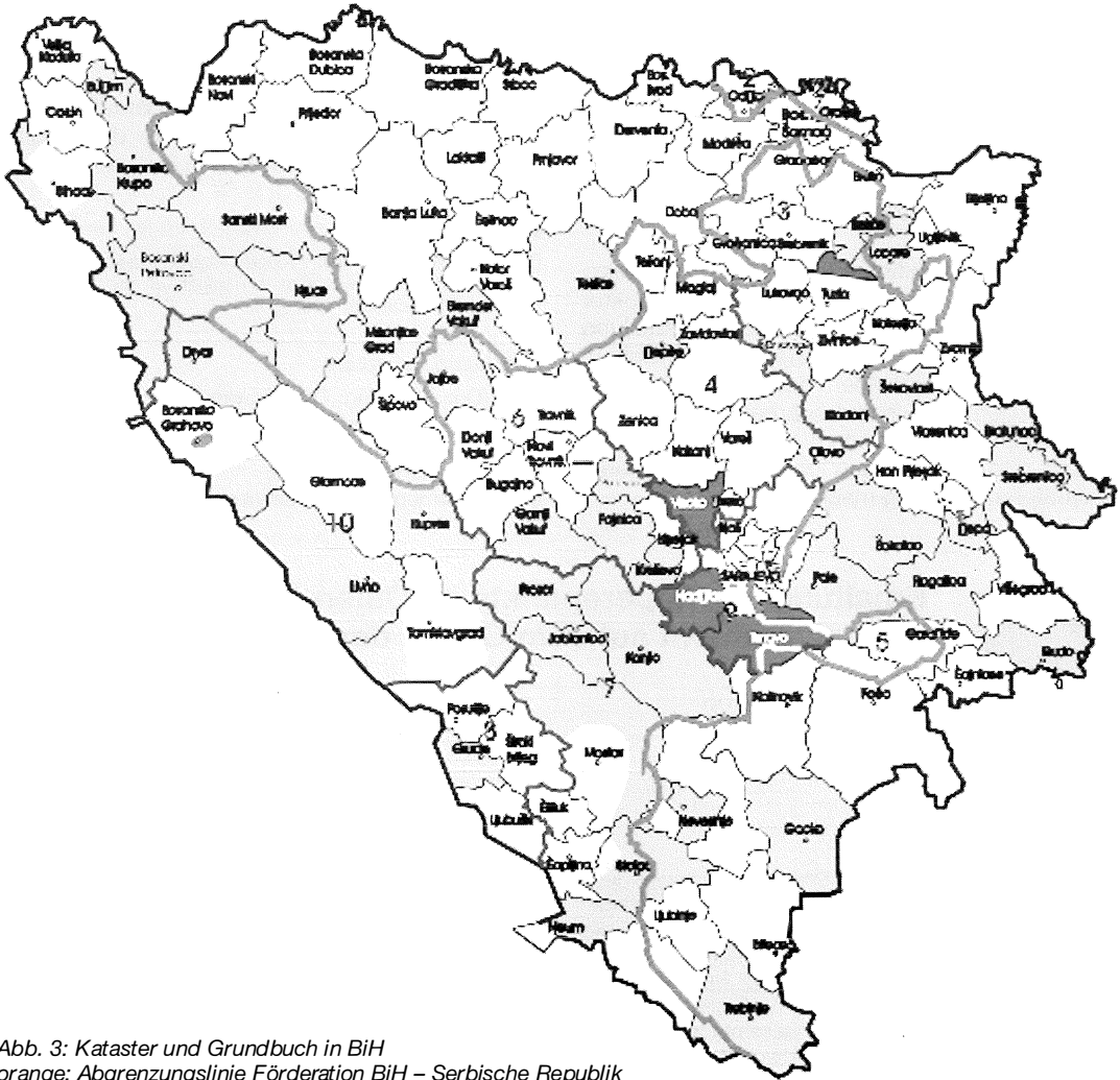
Abb. 3: Kataster und Grundbuch in BiH orange: Abgrenzungslinie Föderation BiH – Serbische Republik weiße Gebiete: Daten aus 1880–1886 blaue Gebiete: Daten aus 1953–1984 rote Gebiete: der „vereinigte Real Estate Cadastre“ ist bereits fertiggestellt. Viele weitere Gemeinden sind in einer Umstellungsphase. Anm. d. Red: die Abbildung in Farbe finden sie auf dem Titelblatt dieser VGI