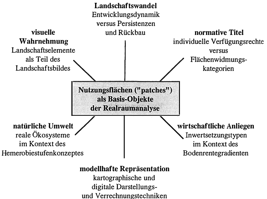
Abb. 2: Nutzungsflächen (Areale unterschiedlichen Nutzungstyps) sind die kleinsten räumlichen Einheiten der Landnutzungserfassung. Welch unterschiedliches gesellschaftliches Interesse an jeder Flächeneinheit bestehen kann, veranschaulicht diese Graphik