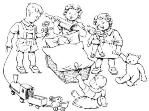
Abb. 5: Geburtsanzeige zu Anselma, der späteren Dipl. Ing. für Geodäsie an der TU Graz

Und vier Geschwisterchen im Bund mit Eifer sie betreuen.