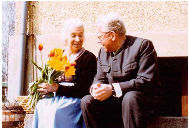
Abb. 9: Siesta auf der Hausbank in Gratkorn